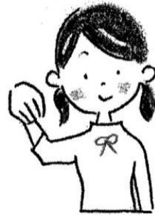
①あかりをつけましょ

又、3月1日には行事食として「ちらし寿司」「はまぐりのお吸い物」「菜の花の和え物」がでます。1つ1つの季節の行事に興味をもち、お祝いをしたり、行事を楽しむ事に繋げていきたいと思ひます。